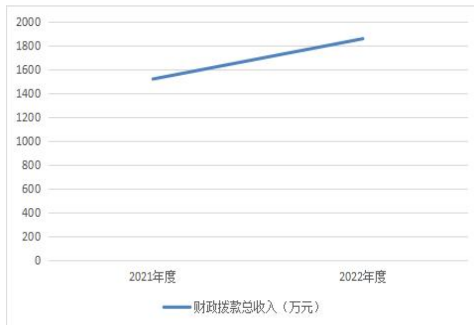
图 4：财政拨款收、支决算总计变动情况

2022 年度财政拨款收入中，一般公共预算财政拨款收入 1705.6 万元，比 2021 年度决算数增加 454.59 万元。增加主要原因是：一是按政策规定调增基本工资标准；二是人员增加导致相关费用增加；三是城管执法力度加强、范围扩大，导致相关整治费用增加。政府性基金预算财政拨款收入 152.69 万元，比 2021 年度决算数减少 116.39 万元。减少主要原因是单位项目减少，导致财政拨款收入相应减少。国有资本经营预算财政拨款收入 0 万元，比 2021 年度决算数增加（减少） 0 万元。增加（减少）主要原因是无变化。