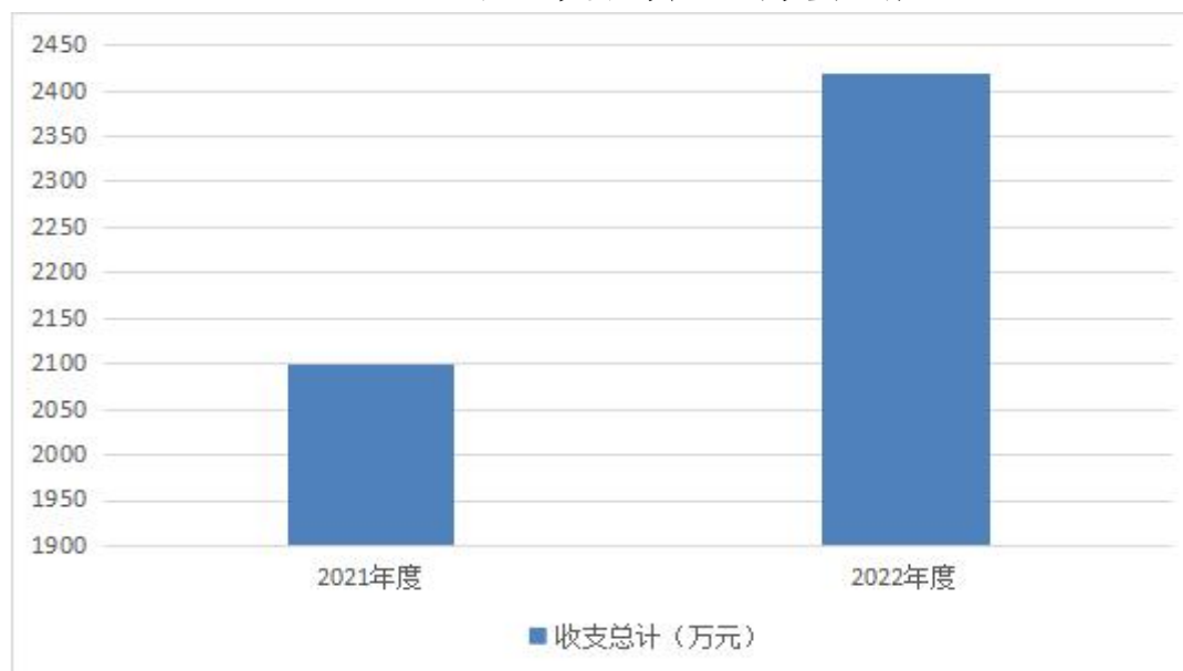
图 1：收、支决算总计变动情况

2022 年度收、支总计均为 2418.68 万元。与 2021 年度相比，收、支总计各增加 319.02 万元，增长 15% ，主要原因是：一是人员增加导致相关费用增加；二是因工作需要新购固定资产；三是城管执法力度加强、范围扩大，导致相关整治费用增加。